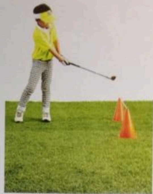
พลักการง่าย ๆ สำหรับการตีพัตต์ให้ลชยได้งข้างคาน ให้วางตำแหน่งลูกไว้ตรงกลางหรือค่อนไปทางซ้ายเล็กน้อย สวิงให้ราบเรียบ และจบวงด้วยการยกหัวเหล็กสูงขึ้น ทำให้ลูกลชยได้งข้างคานได้ง่าย ๆ